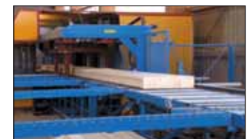
L'usinage en CNC offre un haut niveau de précision lors du montage