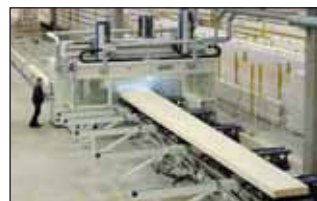
Un centre d'usinage moderne 5 axes pour des poutres grandes longueurs