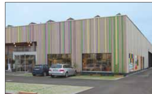
Centre du bois · Kempten