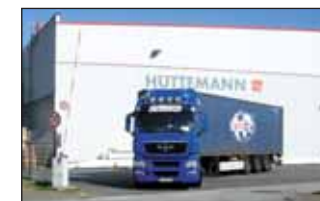
Livraison Juste à Temps dans l'entrepôt ou sur le chantier En Allemagne, en Europe et dans le monde entier