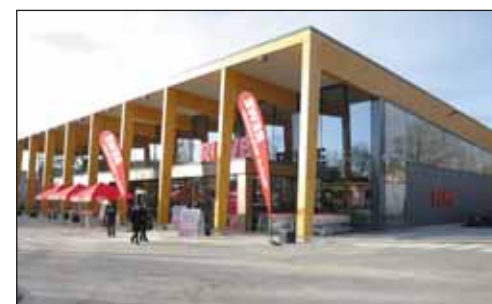
REWE · Hambourg