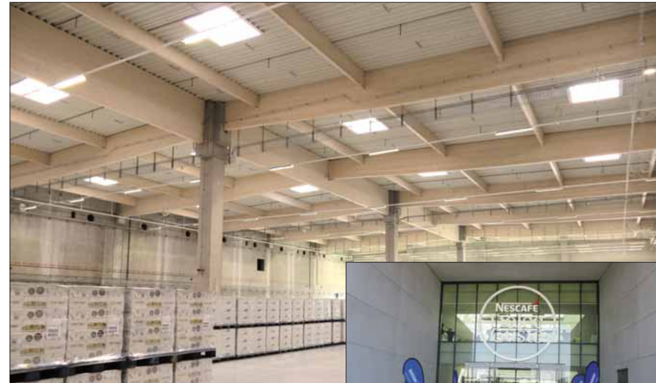
Nestlé Deutschland AG Usine Schwerin