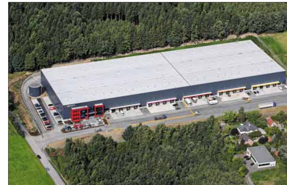
Trilux · Arnberg