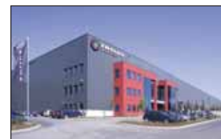
Solutions globales clé en main avec du bois lamellé-collé, Construction de halls complets