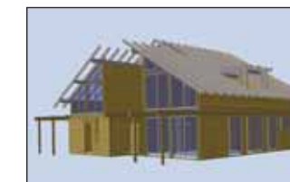
Planification de détail et planification d'usinage