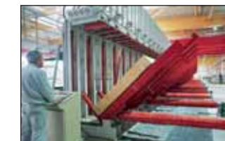
Surveillance constante de la qualité et une technologie moderne de production