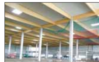
Bois lamellé-collé (BSH) Formes spéciales Structures en bois et halls standards