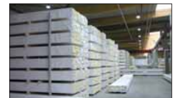
Le plus grand entrepôt de bois lamellé-collé d'Europe