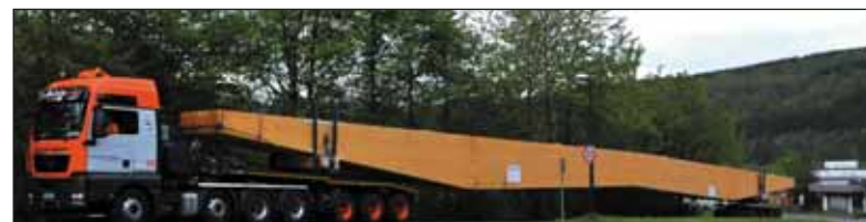
Des éléments pouvant atteindre 56 m de longueur