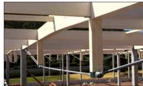
Poutres sous-tendues · Waldkirch

Si vous le souhaitez, nous vous proposons également votre projet en version semi-finie ou clé en main.