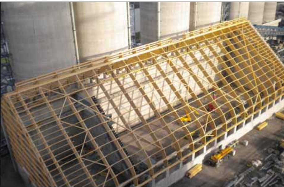
Centrale électrique · Hamm

Le bois d'ingénierie Hüttemann est synonyme de construction en bois de grande qualité. Les constructions autoportantes en BLC offre à la fois grande flexibilité et liberté de conception pour des longueurs jusqu'à 56 m.