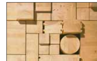
Bois lamellé-collé Diversité des produits alliés à la modernité du matériau de construction