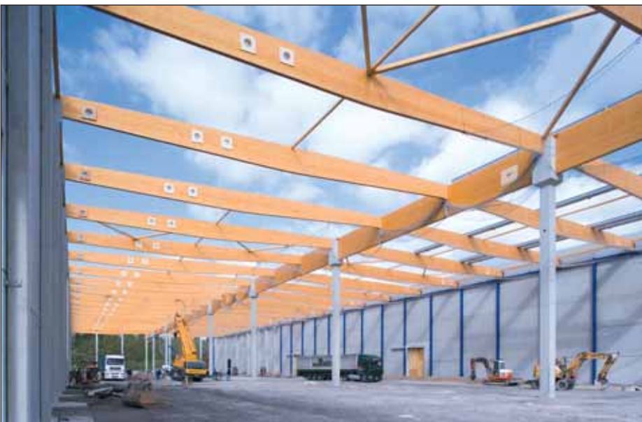
Centre logistique Rhenus · Gießen