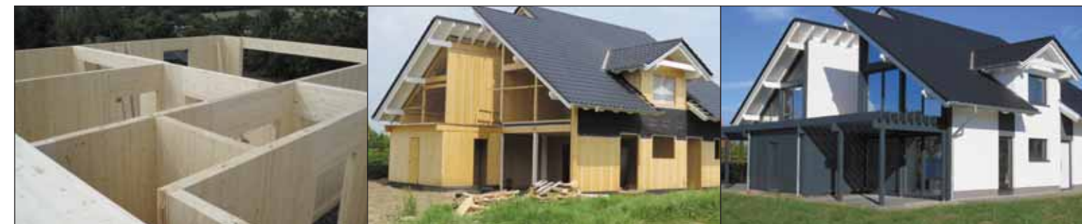
Sec et massif